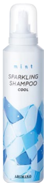
ミント スパークリングシャンプー クール