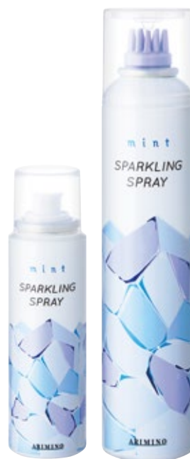
ミント スパークリングスプレー ＜頭皮用トリートメント＞