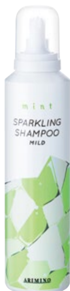
ミント スパークリングシャンプー マイルド