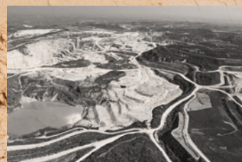
Ensuring environmental sustainability.