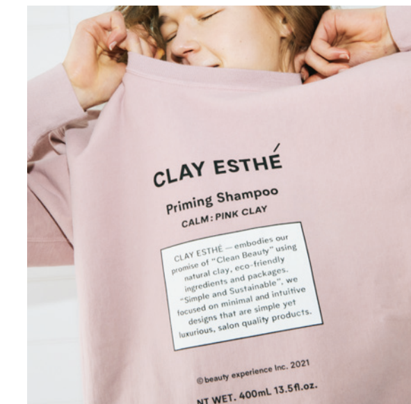
(甘くみずみずしいサボンの香り)