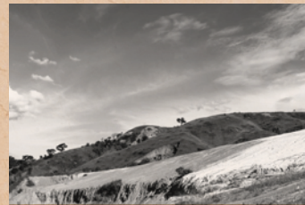
Clay's country of origin is the State of Parana, Brazil.

クレイを採取する際は、上層部の有機層を保護し、採掘後に戻すことで、土地の保護と再生を行っています。