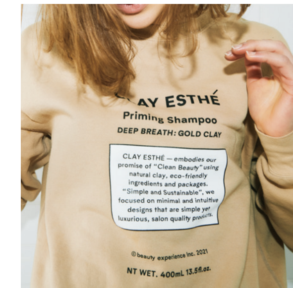
(深呼吸したくなるすっきりとしたヒバの香り)

ゴールドクレイは、深呼吸したくなるすっきりとしたヒバの香り。ナチュラルで爽やかなラベンダーにすっきりとしたユズを合わせ、清潔感あふれるフローラル、自然の息吹を思わせるヒバが重なるハーバルウッドディ。本来であれば廃棄されてしまう、国産のユズの果皮から抽出された精油を配合しています。