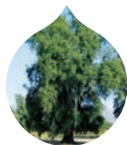
キラヤ キラヤ木エキス