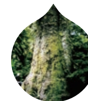
アメリカネズコ木水