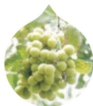
ソーブナッツ サビンヅストリホリアツス果実エキス