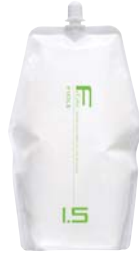
フィヨレ BLカラー OX1.5 第2剤 染毛補助剤 2,000mL 業務用 / 医薬部外品