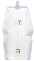
フィヨレ BLカラー OX3 第2剤 染毛補助剤 1,000mL / 2,000mL 業務用 / 医薬部外品