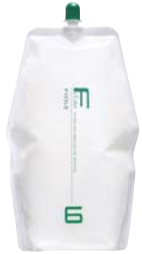
フィヨレ BLカラー OX6 第2剤 染毛補助剤 1,000mL / 2,000mL 業務用 / 医薬部外品