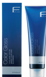
フィオーレ BLカラーグロス 染毛料 200g 19色