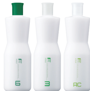
フィオーレ BLカラー OX6 第2剤 染毛補助剤 1,000mL / 2,000mL フィオーレ BLカラー OX3 第2剤 染毛補助剤 1,000mL / 2,000mL フィオーレ BLカラー AC3 (アルカリキヤンセル) 第2剤 染毛補助剤 1,000mL / 2,000mL