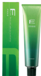
フィオーレ BLカラー 第1剤 120g 82色 フィオーレ BLカラー ライトナー 第1剤 脱色剤 120g