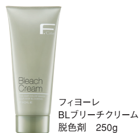
フィオーレ BLブリーチクリーム 脱色剤 250g