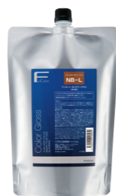
フィオーレ BLカラーグロス 染毛料 900g 6色 NB-L / NB-M / NB-D / OB-L / OB-M / クリア