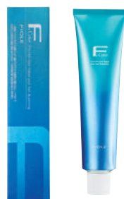
フィオーレ Fカラー クオルシア 第1剤 染毛剤 / 脱色剤 120g 業務用 / 医薬部外品