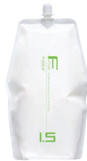
フィオーレ BLカラー OX1.5 第2剤 染毛補助剤 2,000mL 業務用 / 医薬部外品