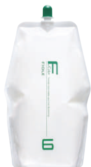
フィオーレ BLカラー OX6 第2剤 染毛補助剤 1,000mL / 2,000mL 業務用 / 医薬部外品