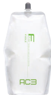
フィオーレ BLカラー AC3(アルカリキャンセル) 第2剤 染毛補助剤 2,000mL 業務用 / 医薬部外品

株式会社フィオーレコスメティクス 〒111-0055 東京都台東区三筋2-23-6 TEL. 03-5821-0216 大阪営業所 TEL. 06-6243-1265 名古屋営業所 TEL. 052-857-0033 札幌営業所 TEL. 011-531-2121 福岡営業所 TEL. 092-432-4323