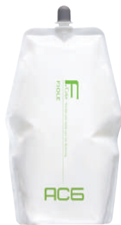
フィオーレ BLカラー AC6(アルカリキャンセル) 第2剤 染毛補助剤 2,000mL 業務用 / 医薬部外品