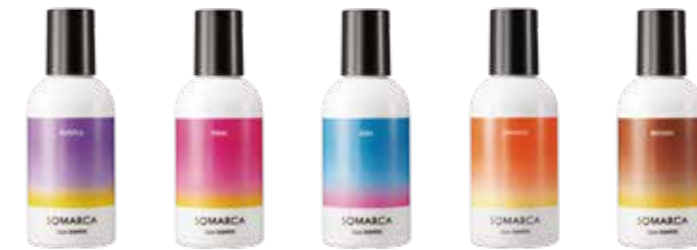
SOMARCA Color SHAMPOO ソマルカ カラーシャンプー〈全5色〉150mL 希望小売価格 2,000円(税抜)