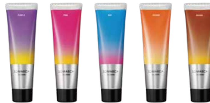
SOMARCA Color CHARGE ソマルカ カラーチャージ〈全5色〉130g 希望小売価格 1,800円(税抜)