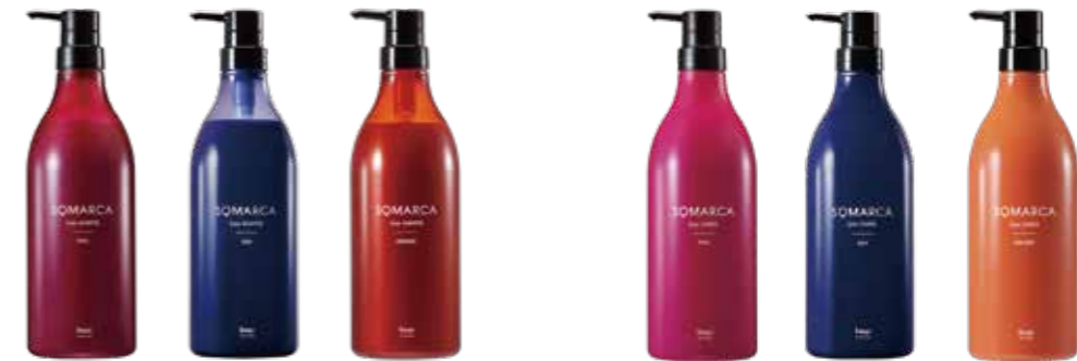
SOMARCA Color SHAMPOO ソマルカ カラーシャンプー 〈全3色/ピンク・アッシュ・オレンジ〉770mL