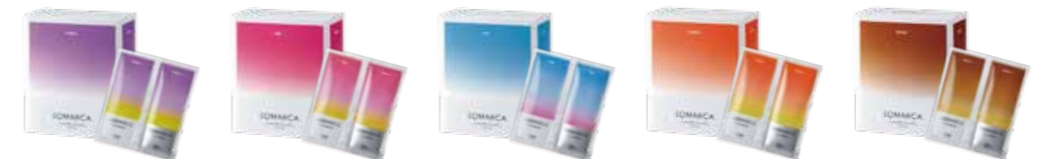
ソマルカ ペアパック(カラーシャンプー10mL・カラーチャージ20g) 12パック入〈全5色〉

トライアルにぴったりのカラーシャンプーとカラーチャージ1回分がセットになったペアパック。 カラーシャンプーに興味をお持ちのお客様に、気軽におすすめいただけます。