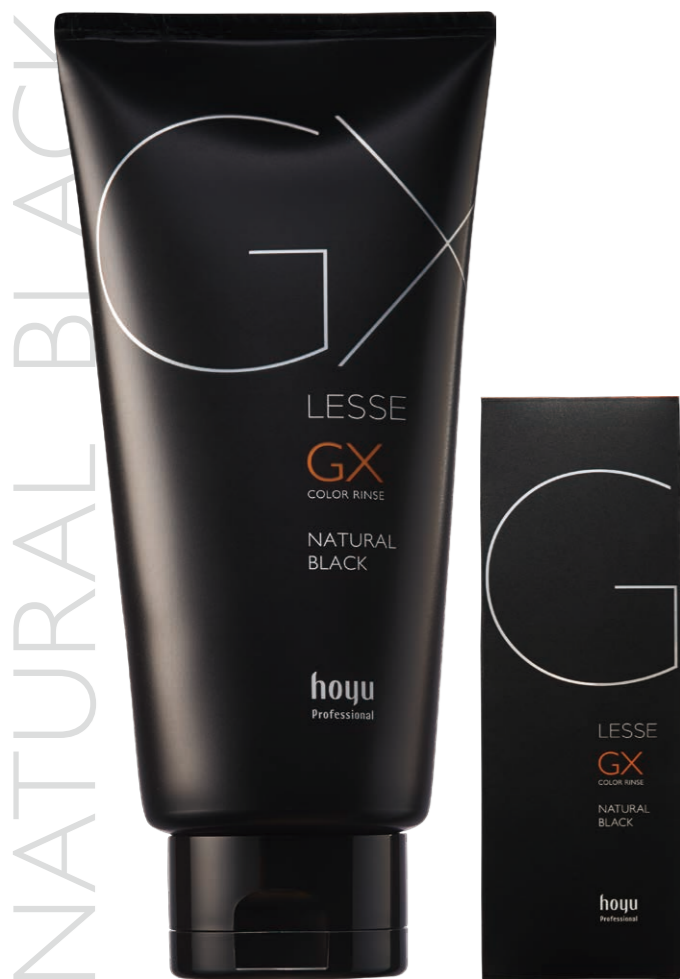
ナチュラルな淡い黒色

LESSE GX カラーリンス ナチュラルブラック 160g 希望小売価格 1,800円(税抜)