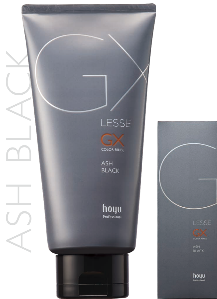
青みのある淡い黒色

LESSE GX カラーリンス ナチュラルブラック 160g 希望小売価格 1,800円(税抜)