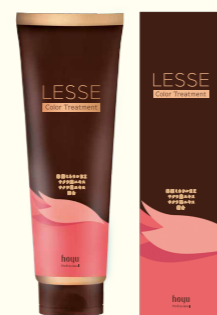
レセ カラートリートメント 245g 全2色 希望小売価格 ¥2,600(税抜)