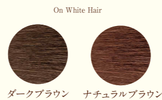
On White Hair