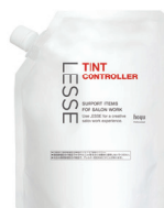
レセ ティントコントローラー 【脱染剤】 300g 医薬部外品