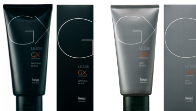
レセ GX カラーリンス 【ヘアトリートメント・染毛料】 160g 全2色 ¥1,980 サロン専売品