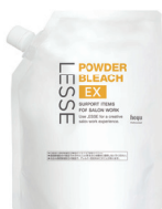
レセ パウダーブリーチ EX 【脱色・脱染剤】 360g 医薬部外品