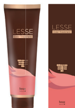
レセ カラートリートメント 【ヘアトリートメント・染毛料】 245g 全2色 ¥2,860 サロン専売品