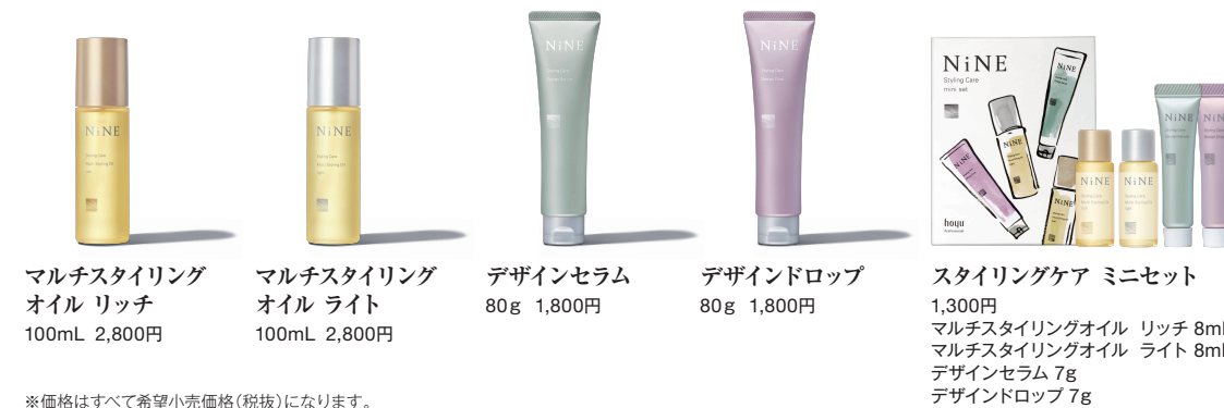
マルチスタイリング オイル リッチ 100mL 2,800円