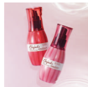
内から潤ったやわふわな髪へ エルジュダ エマルジョン 120g エルジュダ エマルジョン+ 120g 〈ヘアトリートメント〉各2,600円(税抜)