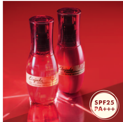
ダメージケア&紫外線カット、潤いのある髪へ エルジュダ サントリートメント セラム 120mL エルジュダ サントリートメント エマルジョン 120g 〈ヘアトリートメント・頭皮用日やけ止め〉各2,800円(税抜)