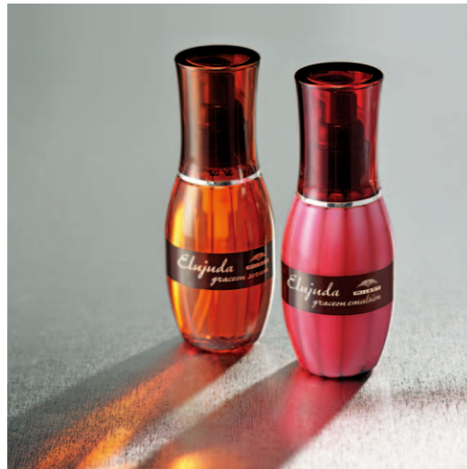
毛先が自然と内に入るやわらかな髪へ エルジュダ グレイソン セラム 120mL エルジュダ グレイソン エマルジョン 120g 〈ヘアトリートメント〉各2,800円(税抜)

サロン仕上げの心地よさを、どんな時も。 女性のライフシーンに寄り添う「エルジュダ」。