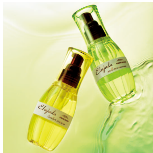
根元からしなやかで動きやすい髪へ エルジュダ リンパーセラム 120mL エルジュダ メロウセラム 120mL 〈ヘアトリートメント〉各2,800円(税抜)