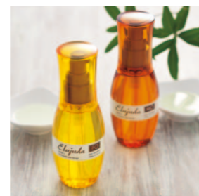
やわらかで動かしやすい髪へ エルジュダ FO 120mL エルジュダ MO 120mL 〈ヘアトリートメント〉各2,600円(税抜)