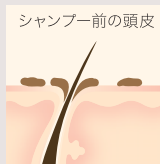
シャンプー前の頭皮 通常のシャンプーでは落ちにくい過酸化脂質などが、頭皮に残っている状態。