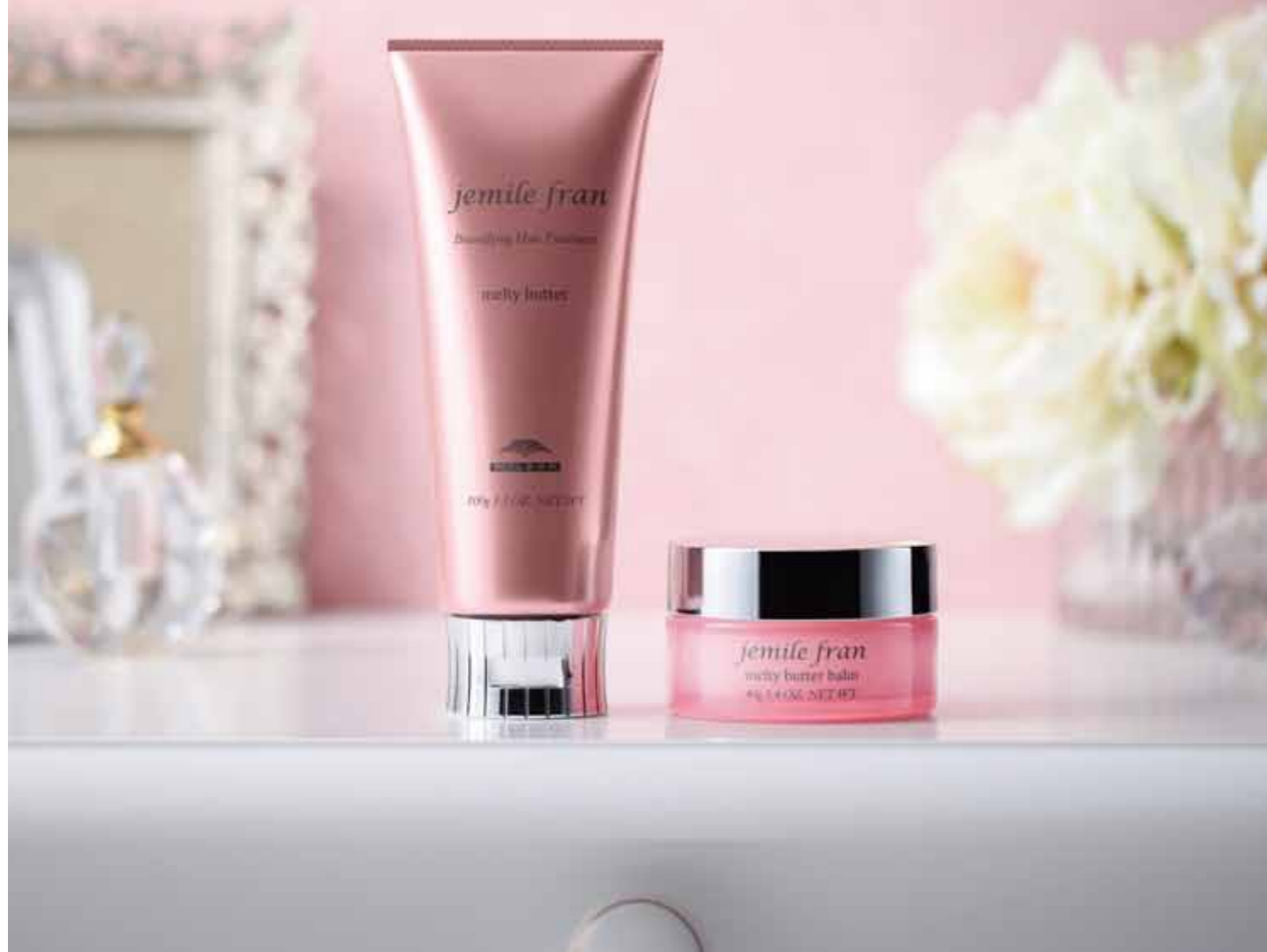
ジェミールフラン メルティバター 100g ¥2,000 (税抜) ジェミールフラン メルティバターバーム 40g ¥2,200 (税抜)