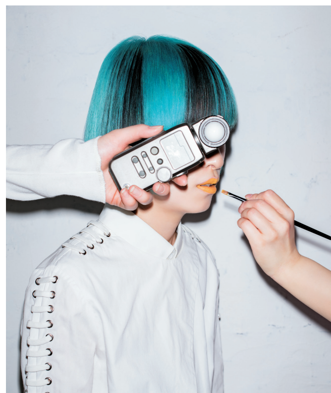
BEFORE >> 18.5Lv