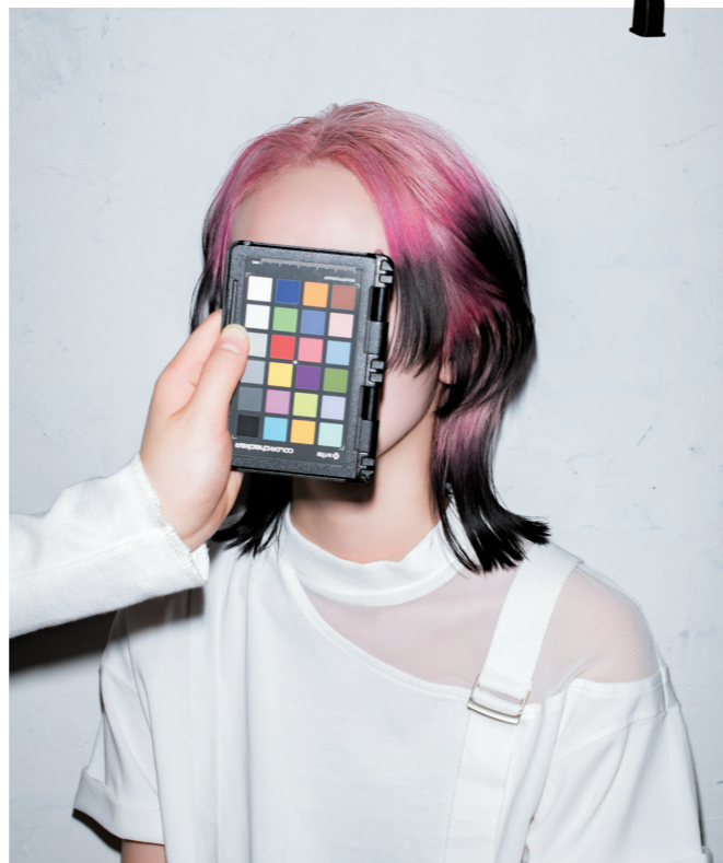
BEFORE >> 18Lv