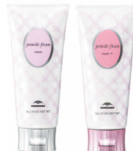
毛流れに表情をつくる クリーム クリーム+ 各 80g ¥1,600(税抜)