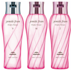
ごわごわ髪がやわらかく ヒートグロス シャンプー S/M/J 各 200mL ¥1,800(税抜)