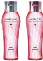
内側からやわらかく シャンプー H シャンプー D 各 200mL ¥1,800(税抜)