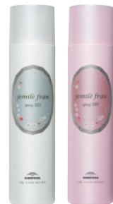
いつもと違う雰囲気づくり スプレーSD スプレーSW 各 150g ¥1,600(税抜)

株式会社ミルボン 本社 東京都中央区京橋2-2-1 京橋エドグラン 〒104-0031 TEL.03-3517-3915