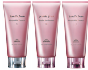
どんより髪がツツツツに ヒートグロス ヘアトリートメント S/M/J 各 180g ¥2,000(税抜)