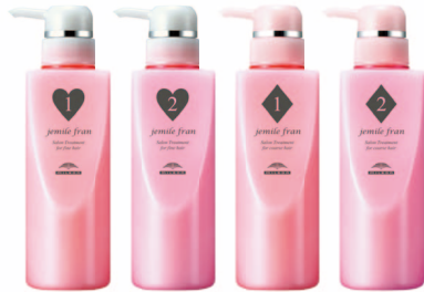
毎日ツルんが叶うサロンの土台作り サロントリートメント ハート1 / ハート2 / ダイア1 / ダイア2 各 600g パック業務用(詰替用) 業務用ポンプ付ボトル(詰替用)