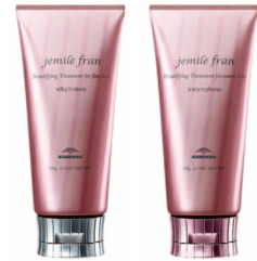
やわらかツルんの手触りに シルキークシャニー / ジューシーグロッシェ ヘアトリートメント 各 180g ¥2,000(税抜)