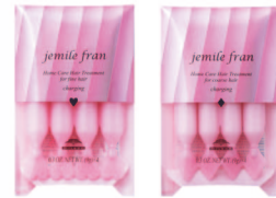
週1のスペシャルホームケア ハートチャージング / ダイアチャージング (ヘアトリートメント) 各 9g x 4連