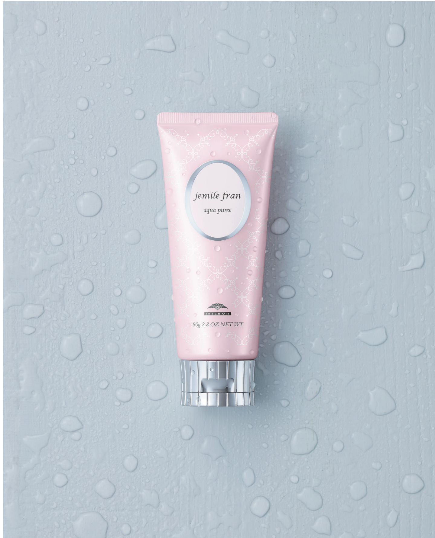
ジェミールフラン アクアピュレ 80g ¥1,600 (税抜)

●ミルボン製品は、ヘアデザイナーのアドバイスによりご使用いただく、美容室専売品です。 ●本掲載のヘアスタイル等の写真および、記事・イラスト・ロゴなどの無断転載・複製・改変は、法律により禁じられています。