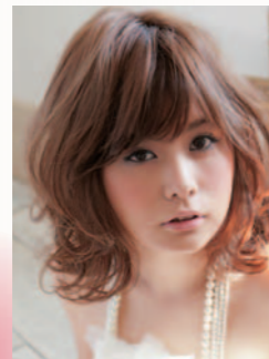
ニゼル スウィングムーブ ヴェール 180g/1,600円(税抜)