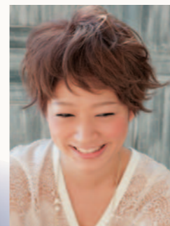
ニゼル ホールドフィット ヴェール 180g/1,600円(税抜)