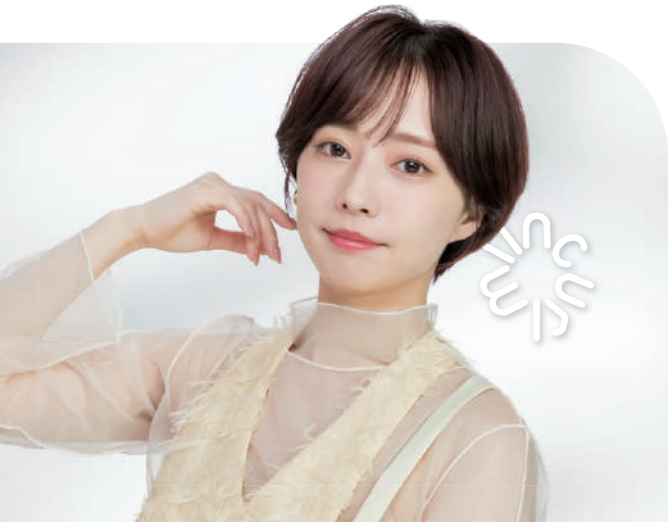
smooth sheer primer