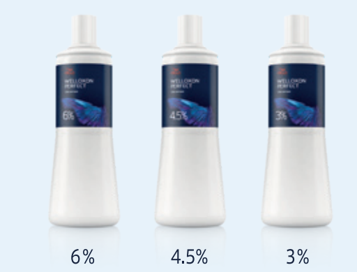
6% 4.5% 3%

2 剤 ウエロキソン パーフェクト+ 1,000mL 仕上がりにイメージに合わせて、最適なものをお選びください [医薬部外品]