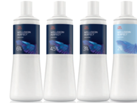
ウエロキソンパーフェクト+(2剤) [医薬部外品] 1,000mL 6%, 4.5%, 3%, AC2%