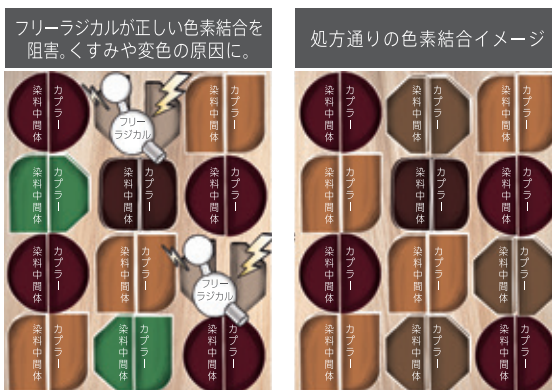
ピュアバランステクノロジーなし ピュアバランステクノロジーあり

毛髪で発生したフリーラジカルは、ヘアカラーの発色に大きな影響を与えます。フリーラジカルによってカプラーが正しい染料中間体と結合できず、間違った色の分子が形成されることで、本来の色調とは異なる色調に変化してしまいます。その結果、狙い通りの正確な色表現が困難になるのです。