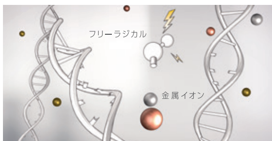
フリーラジカルがキューティクルの結合を破壊し、ダメージの一因に。

生成されたフリーラジカルは、ヘアカラーの色表現を阻害するだけでなく、キューティクルのケラチン結合を切断します。それがダメージを引き起こす一因になっています。