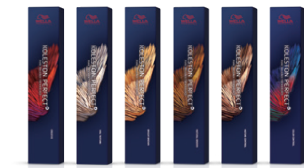
コレストンパーフェクト+(1剤) 80g 全165色 [医薬部外品]