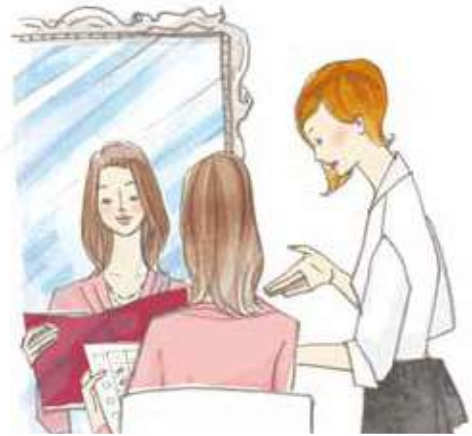
(活用シーン：カウンセリング時)