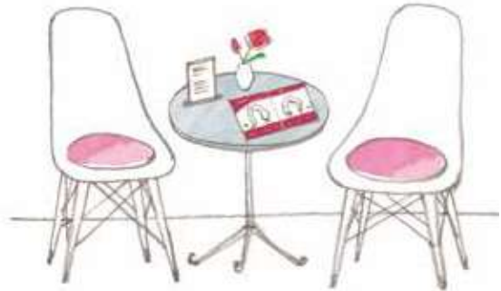
(活用シーン：待合スペース・カウンセリング時)

カラーバリエーションと機能(5つの効果)をお客さまと一緒に確認できる カラーチャート