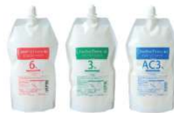
クリエイティブ フェリエ ネオ カラーオキシド 6%・3%・AC3%(アルカリキャンセル) NET.1000g