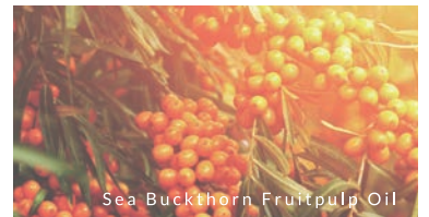
Sea Buckthorn Fruitpulp Oil

髪のベースを整えながら、ナチュラルに仕上げる。まるで、スキンケア感覚のスタイリング。