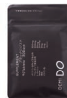
SUPPLEMENT ブラックロジスト

発芽エンドウ豆エキス末 ケラチン加水分解物 L-シスチン L-リシン塩酸塩 L-メチオニン