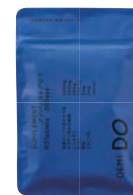
SUPPLEMENT アドバンストグロウ

亜鉛は、味覚を正常に保つのに必要な栄養素です。 亜鉛は、皮膚や粘膜の健康維持を助ける栄養素です。 亜鉛は、たんぱく質・核酸の代謝に関与して、健康の維持に役立つ栄養素です。 ビタミンB6は、たんぱく質からのエネルギーの産生と皮膚や粘膜の健康維持を助ける栄養素です。