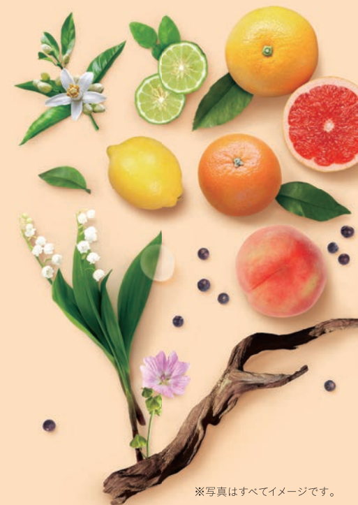
※写真はすべてイメージです。