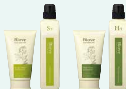
スカルプリラックス トリートメント [医薬部外品]

240g ¥3,200(税抜) 550g ¥5,200(税抜) 450g(詰替) ¥3,700(税抜) 2,000g(詰替)/業務用