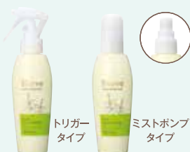
フォルスナリシグ