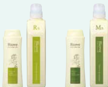
リフレッシュスカルプ シャンプー [医薬部外品]

250mL ¥2,400(税抜) 550mL ¥4,100(税抜) 450mL(詰替) ¥2,800(税抜) 2,000mL(詰替)/業務用