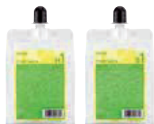
カールミルク H1/S1 [業務用]