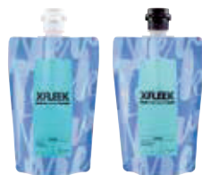
シャンプー/ヘアトリートメント ニフティマリン