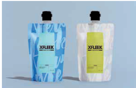
ヘアトリートメント ニフティマリン