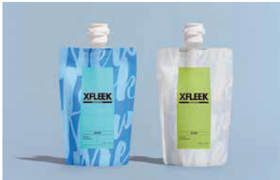
シャンプー ニフティマリン