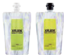
シャンプー/ヘアトリートメント カーミストサボン

シャンプー 各250mL ¥1,800 各1000mL (詰替) ¥4,800 ヘアトリートメント 各250g ¥2,200 各1000g (詰替) ¥5,800