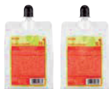
カールリキッド H1/S1 [業務用]