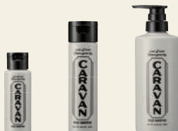
MILD SHAMPOO マイルドシャンプー

50mL ¥605 / 250mL ¥2,750 / 490mL ¥4,290 / 1000mL (詰替) ¥6,380