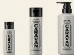
REFRESH SHAMPOO リフレッシュシャンプー

50mL ¥605 / 250mL ¥2,750 / 490mL ¥4,290 / 1000mL (詰替) ¥6,380