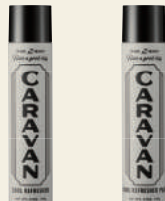
COOL REFRESHER COOL REFRESHER PLUS

50g ¥825 / 240g ¥3,300 / 485g ¥5,170 / 1000g (詰替) ¥7,590