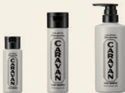
SCALP SHAMPOO [医薬部外品] スカルプシャンプー