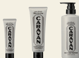
HAIR & SCALP TREATMENT ヘア&スカルプトリートメント

50mL ¥605 / 250mL ¥2,750 / 490mL ¥4,290 / 1000mL (詰替) ¥6,380