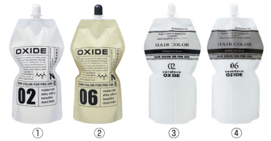
① ② ③ ④

キャラデコ トナー ® ブリーチパウダー EXとキャラデコ第2剤を1:3の割合でミックスします。