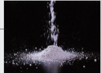
キャラデコ トナー ® ブリーチパウダー EX