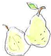
○ OSMANTHUS 乳酸桿菌/セイヨウナシ 果汁発酵液