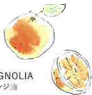
● MAGNOLIA オレンジ油