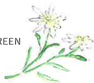
● CITRUS GREEN エーデルワイス 花/葉エキス