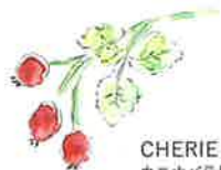
CHERIE SAVON カニナバラ果実エキス