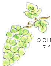
○ CLEAR ブドウ種子油