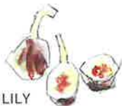
TENDER LILY イチゾク樹皮エキス