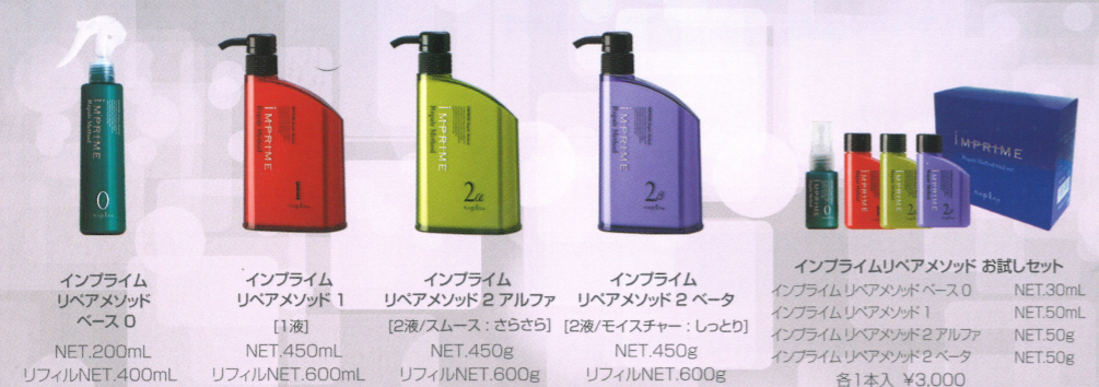
インプライム リペアメソッド ベース0 NET.200mL リフィルNET.400mL

「コスト・時間・持続性」向上をテーマに開発したサロン&ホームケアトリートメントシステムです。サロントリートメントのアイテムとして、ダメージ内部補修用、栄養と水分を補給・定着させるための1液、希望する質感に向上させる2液をラインナップ。ご自宅でサロントリートメント後の質感を向上させる、ホームケア用トリートメントも2タイプをご用意。枝毛・切れ毛・毛先のダメージケアに着目し、保湿・補修効果に優れたアルガンオイルを共通配合し、思わず触れたくなるような、うるおいに満ちたしなやかな髪へと導きます。