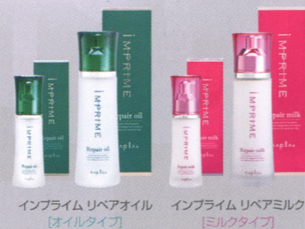
インプライム リペアオイル [オイルタイプ]

保湿・補修効果に優れたアルガンオイル、キューティクルを補修・保護するオーガニックオイル、ホホバ種子油・オリーブ油を配合。UVケア成分も配合し、紫外線によるダメージもケアします。広がりやすい・バサつきやすい方には、毛先までつややかに指通り良く仕上げる「リペアオイル」。毛先のもつれが気になる方、パーマスタイルの方のベースメイクに最適な「リペアミルク」はなめらかでさらとした質感へと導きます。