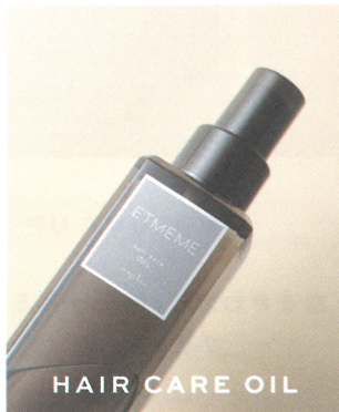
HAIR CARE OIL