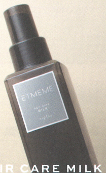
HAIR CARE MILK