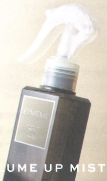
VOLUME UP MIST