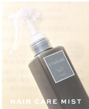
HAIR CARE MIST