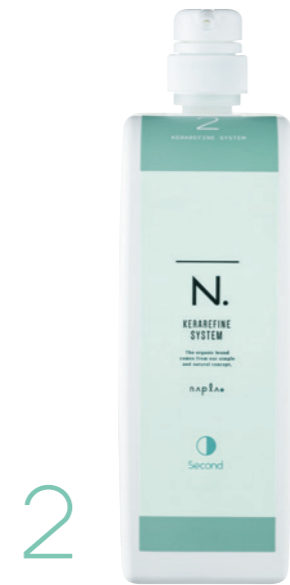
N. ケラリファイン システムトリートメント 2nd ＜ヘアトリートメント＞ 1,000g (リフィル)