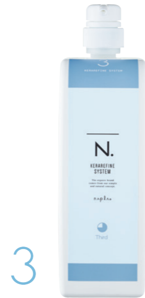
N. ケラリファイン システムトリートメント 3rd ＜ヘアトリートメント＞ 1,000g (リフィル)