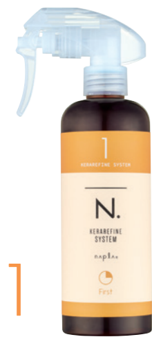
N. ケラリファイン システムトリートメント 1st ＜ヘアトリートメントミストタイプ＞ 300mL/600mL (リフィル)

ダイヤモンドと同じく炭素のみから構成される成分「フラーレン」。天然保湿因子やセラミドの減少を抑え、毛髪にうるおいを与えてみずみずしい健やかな髪へと導きます。