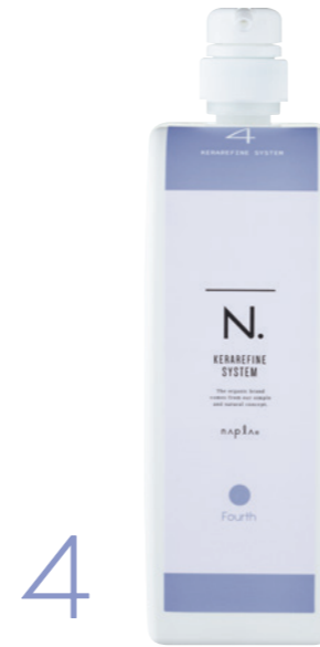
N. ケラリファイン システムトリートメント 4th ＜ヘアトリートメント＞ 1,000g (リフィル)