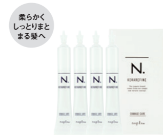
N. ケラリファイン ダメージケア ＜ヘアトリートメント＞ 15g×4 1,200円+税