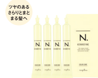
N. ケラリファイン カラーケア ＜ヘアトリートメント＞ 15g×4 1,200円+税