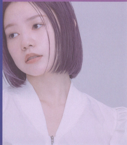
アイリス IRIS Before / 17Lv 7-IR単品