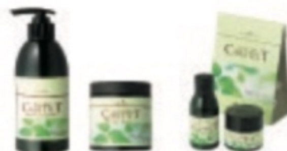
ケアテクトHB カラーシャンプー・トリートメントS しっとりタイプ

シャンプー トリートメント 300ml 2,100円(税込) 200g 2,520円(税込) 750ml 4,200円(税込) 500g 5,040円(税込) 1.75L 1,200ml 5,460円(税込) 1.75L 1,200g 7,000円(税込) お買い得セット シャンプー 60ml トリートメント 60g 840円(税込)