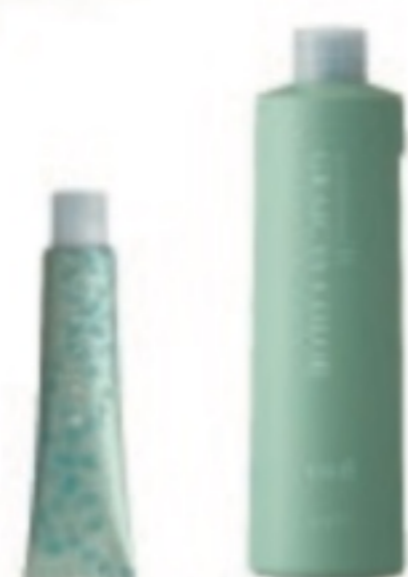
第1剤 NET80g (全51色) 第2剤 NET1,000ml (OX9%・OX3%)