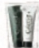
ケアテクトHB カラーシャンプー・トリートメントI ファーストシャンプー・ファーストトリートメント セット価格 840円(税込)

シャンプー トリートメント 300ml 2,100円(税込) 200g 2,520円(税込) 750ml 4,200円(税込) 500g 5,040円(税込) 1.75L 1,200ml 5,460円(税込) 1.75L 1,200g 7,000円(税込) お買い得セット シャンプー 60ml トリートメント 60g 840円(税込)