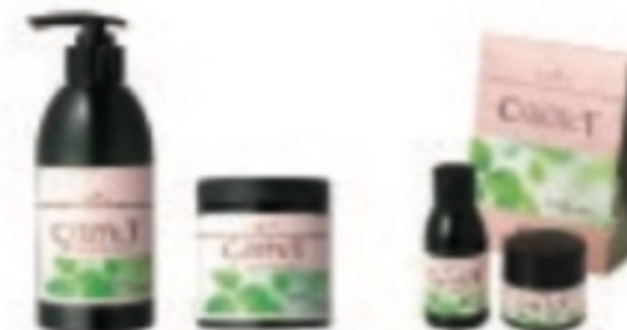
ケアテクトHB カラーシャンプー・トリートメントV ハリコンジタイプ

シャンプー トリートメント 300ml 2,100円(税込) 200g 2,520円(税込) 750ml 4,200円(税込) 500g 5,040円(税込) 1.75L 1,200ml 5,460円(税込) 1.75L 1,200g 7,000円(税込) お買い得セット シャンプー 60ml トリートメント 60g 840円(税込)