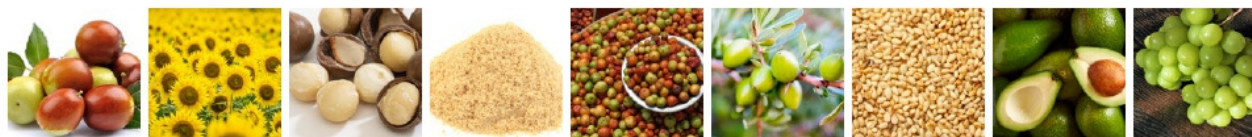
ホホバ種子油 ヒマワリ種子油 マカデミア種子油 コメヌカ種子油 スクロカリアピレア種子油 アルガニアスピノサ核油 ゴマ油 アボカド油 ブドウ種子油