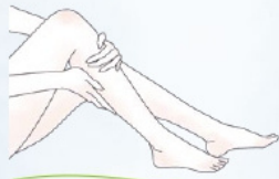
フットマッサージ・かかとケア