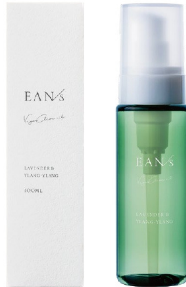
エアンス ヴィーガンクリアオイル 〈ヘア&ボディ&ハンド&フェイシャル用オイル〉