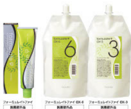
フォーミュレイトファイ 既製剤外品

「フォーミュレイトファイ」は、たった38色であらゆる髪色を作り出すことができるまったく新しいコンセプトのヘアカラー剤です。その上、高彩度から低彩度まで、ファッションカラーからグレイカラーまでのすべてに対応します。発色色とツヤ感、ダメージレスでしなやかな髪通り、これら全てを高いレベルで実現する画期的なヘアカラー剤です。